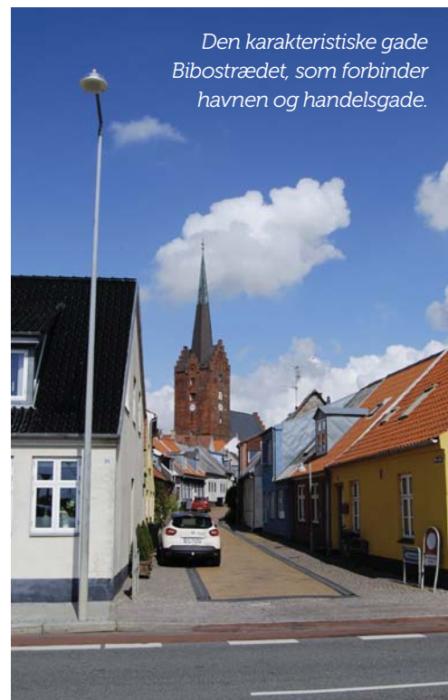
Den karakteristiske gade Bibostrædet, som forbinder havnen og handelsgade.

Tid/rum matricen er et redskab, som her bruges til at systematisere og formidle den viden, som gennem analysens tidligere trin er indsamlet om bymidten og delområderne.