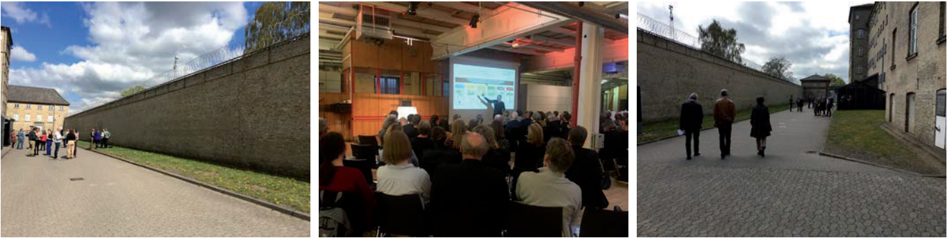
Konferencen "Landsbyernes fremtid" blev afholdt i Fængslet i Horsens.