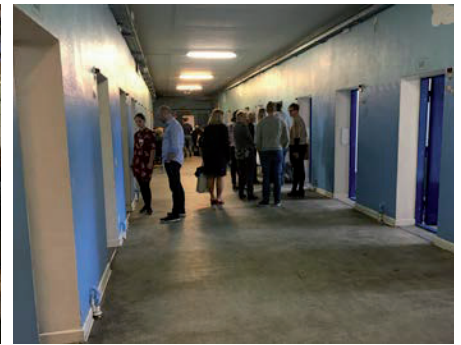
Konferencen "Landsbyernes fremtid" blev afholdt i Fængslet i Horsens.