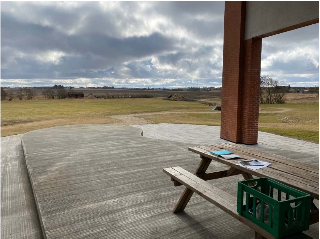
Udsigt fra Karby Kubers underum over landskabet.