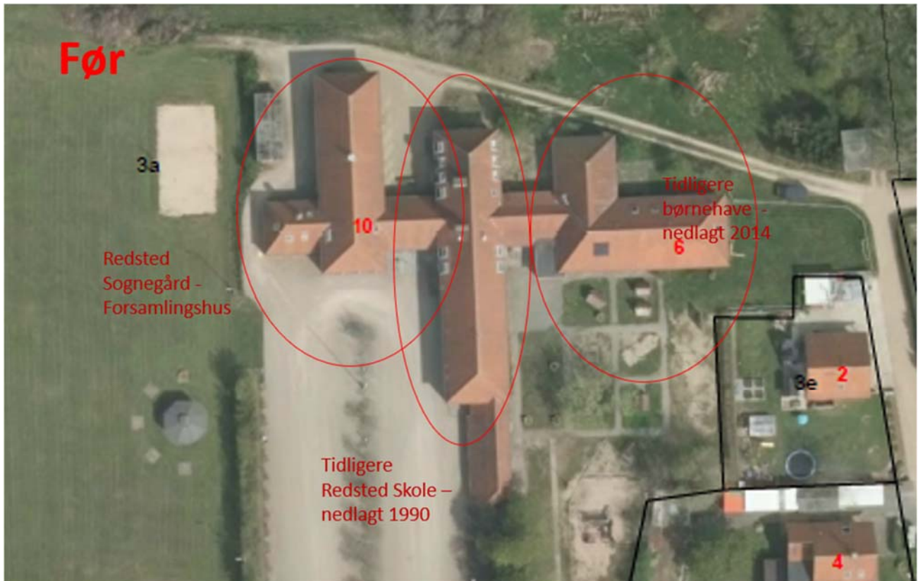
Redsted Sognegård før. Illustration fra Morsø Kommune.

og fysisk forandring, taget i anvendelse. Embedsmændene forestod en modningsproces, der bl.a. bød på forskellige scenarier for bygningen – at lade den stå eller rive forskellige dele ned. Modningsprocessen blev afsluttet ved at de lokale til sidst sagde; nu skal vi have det her afsluttet og revet ned. Således blev en del af bygningen revet ned i 2019, mens forsamlingshusdelen blev bevaret og løftet med moderne toiletter og varmesystem. Desuden er der lavet fx moderne køkkenfaciliteter, som er realiseret for fondsmidler.