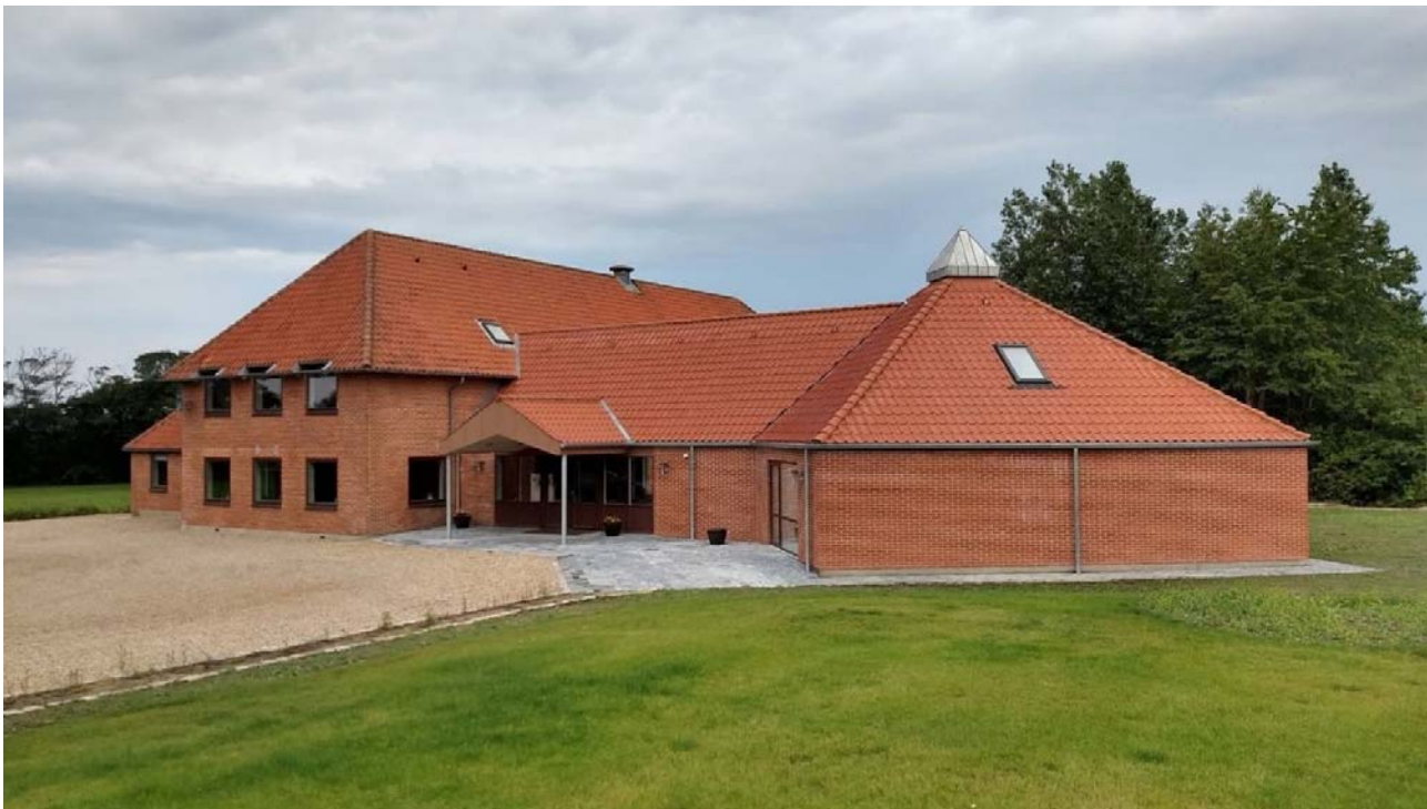
Redsted Sognegård efter ombygning.