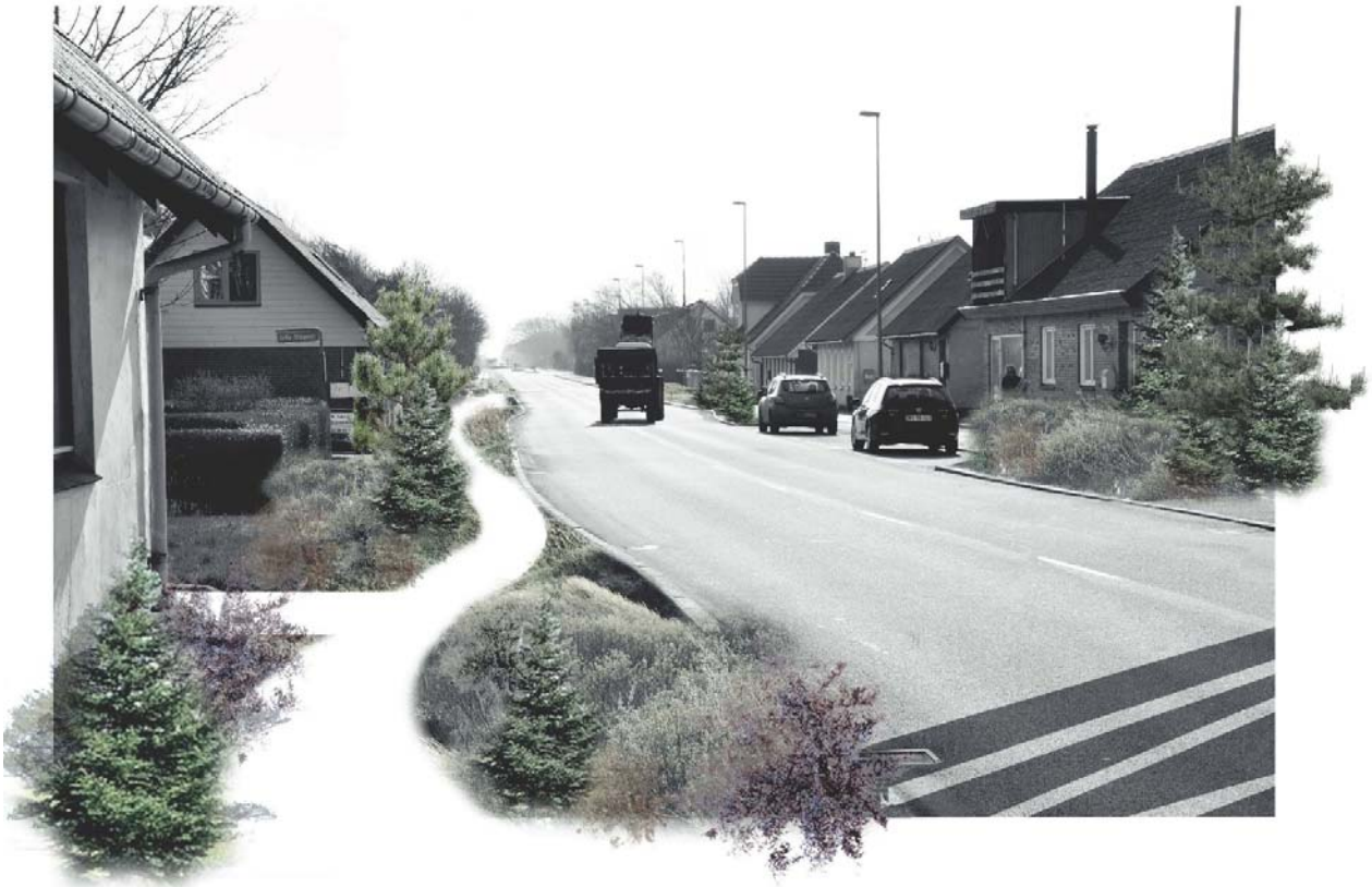
Visualisering af vejprojektet. Hjørring Kommune.

Sammen med landsbyens borgere blev der i 2017 udviklet en plan, som fysisk skulle markere landsbyens tyngdepunkt, samt forkorte strækningen med bymæssig bebyggelse fra 1400 m til 400 m, hvor der var hastighedsbegrænsning på 50 km. Der blev nedsat en samarbejdsgruppe med frivillige ildsjæle, der meldt sig til udviklingsarbejdet, og en lokal arbejdsgruppe kom på ideen om at lave en kombineret gang- og cykelsti, hvilket blev tiltrådt af projektet. Desuden skulle den kombinerede fortov-cykelsti slynges for at bringe trafikanter ned i fart. Denne indsats har desuden medført at kommunen fremover fortrinsvist vil erhverve og nedrive ejendomme udenfor de centrale 400 meter i midten af Sdr. Rubjerg.