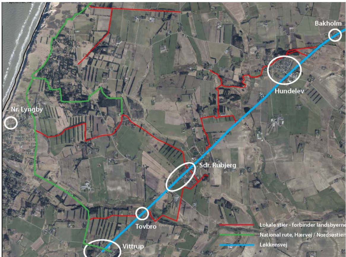
Skærmdump af fra Hjerring Kommunes giskort med forskellige typer stier.