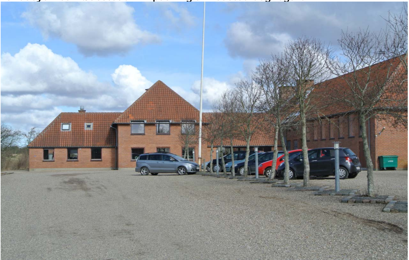
Redsted Sognegård før.

En væsentlig indsats under dette tema har været arbejdet med at tilpasse Redsted Sognegård, som altid har haft funktion af forsamlingshus og som tidligere både har været skole (nedlagt 1990) og børnehave (nedlagt 2014). Det var et større bygningskompleks, der delte ankomstarealer, toiletfaciliteter, depot og varmesystem. Embedsmændene beskriver en række barrierer vedrørende tilpasningsprojektet, da der lokalt var mange urealistiske ideer om at bruge de mange lokaler til fx ungdomsboliger og rugekasser for virksomheder. Her blev projektets værktøjer til at arbejde med mental