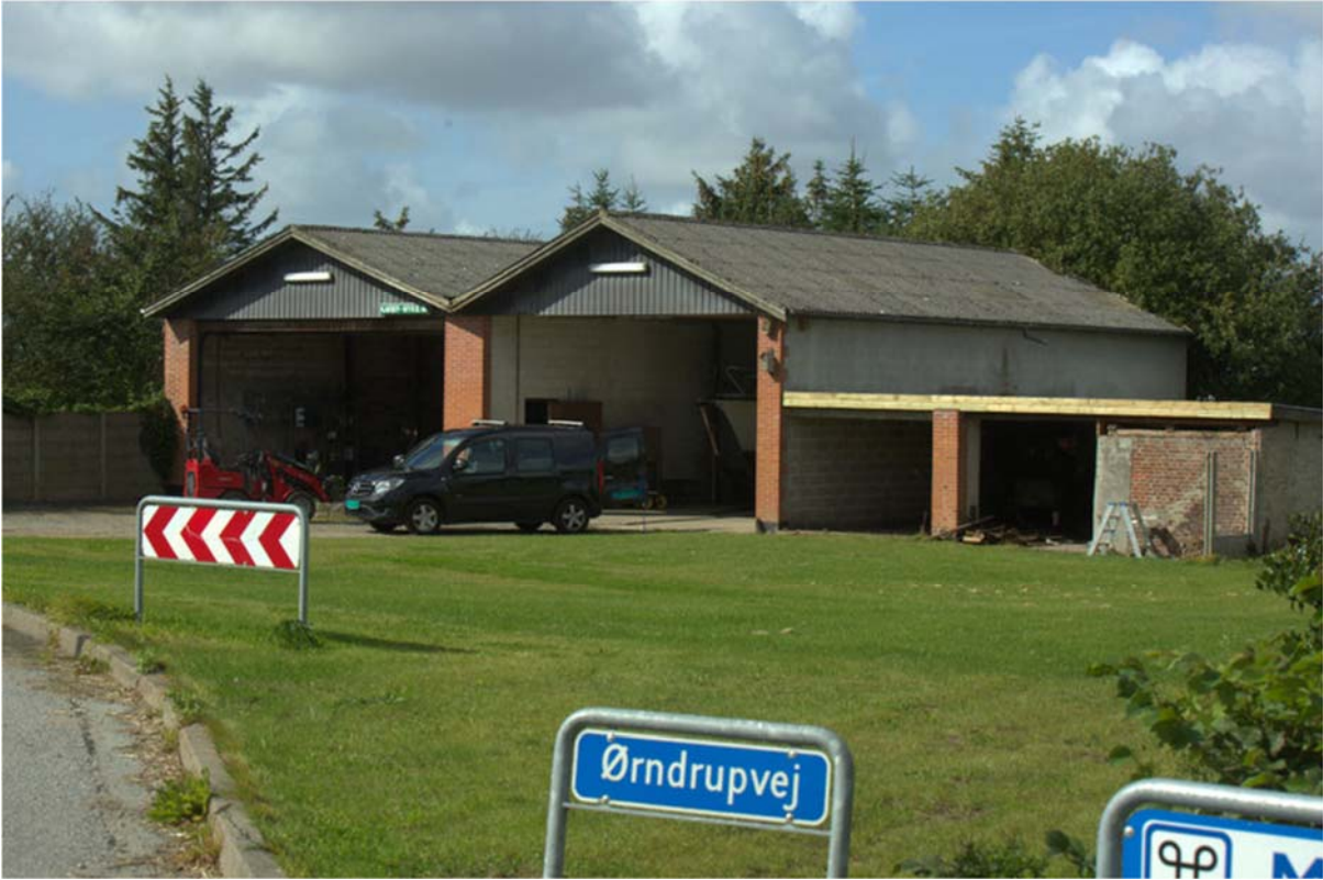
Palles hus der ligger i et vejsving, så når man kører ind i Karby fra syd, er der nu udsigt til Limfjorden i stedet for Palles hus.

arbejdet meget hensynsfuldt, var dette en fodfejl. En anden metode er kort/luftfotos af området med bløde markeringer af landskabskig/hvor landskabet kunne trækkes ind. Kommunens erfaring var at dette bedre kan accepteres lokalt, hvorfor kommunens embedsmænd anbefaler denne metode.