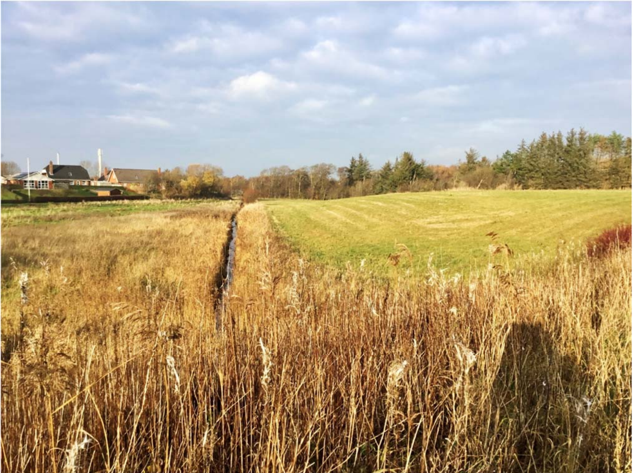
De to arealer i ådalen er adskilt af Grønningsbækken.

En projektmålsætning var at styrke byens rekreative muligheder ved at lette adgangen til landskabet og i 2018 gik kommunen i gang med at erhverve to engarealer i en ådal sydøst for byen, hvor vandløbet Grønningsbækken løber og somme tider oversvømmer arealerne. Arealerne var ejet af landmænd, hvoraf den ene gerne ville afhænde sit areal gratis til borgerforeningen, der ville arbejde med afgræsning og måske shelterplads. Den anden landmand ville kun afhænde ved salg.