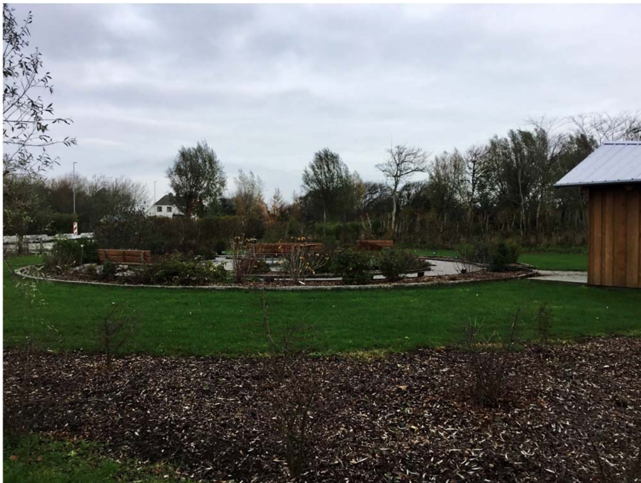
Bjeskhaven, maj 2021.

clash mellem den vilde æstetik, som projektet kom med, og den æstetik de lokale ønsker, der er mere plejet. Spørgsmålet er her, om ikke det er af mindre betydning, hvilket udtryk bjeskhaven har, når det nu er lykkedes at forankre driften af den lokalt?