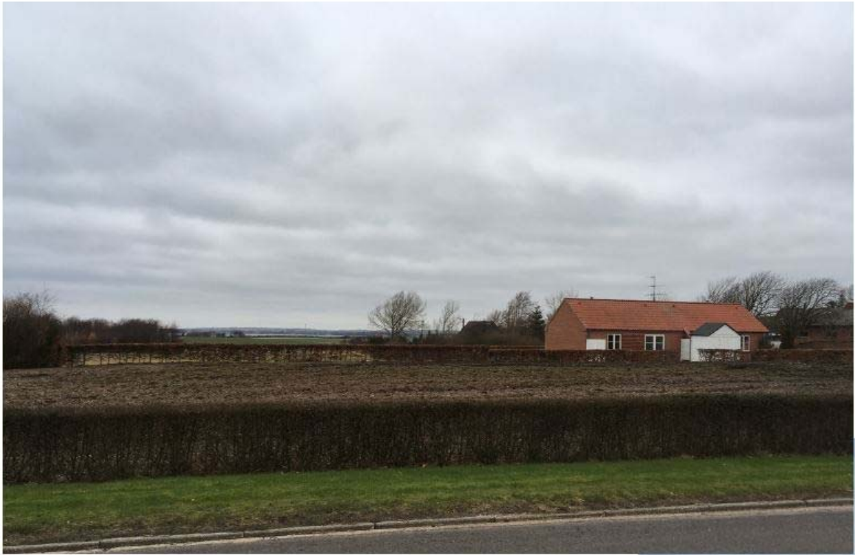
Landskab i stedet for ældreboliger i Tæbring og området opleves nu i sammenhæng med det åbne land og udsigten over Limfjorden.