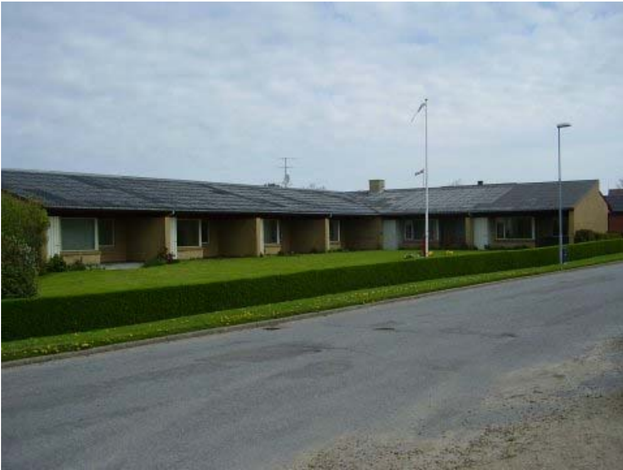
Ældreboliger i Tæbring – før nedrivning.