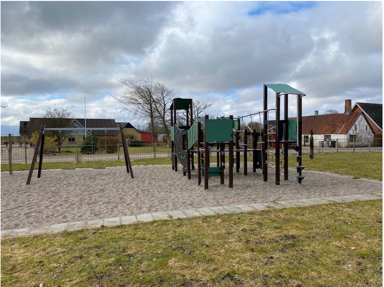
Legeplads i Tæbring Bypark.