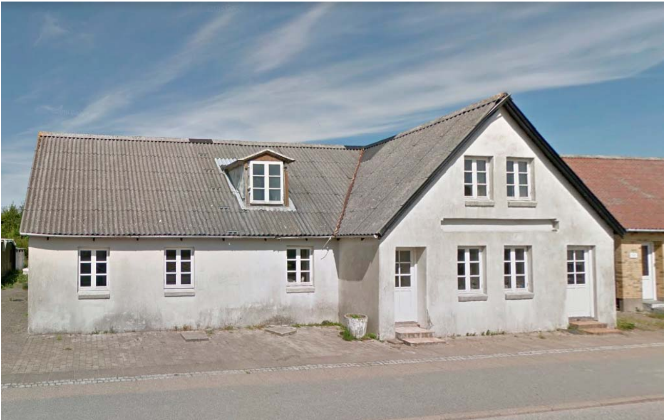
Thorkild Simonsen-ejendommen 2018.

længe urealistisk dyrt til salg, og gik på tvangsauktion. Både embedsmænd og frivillige giver udtryk for at ejendommen er i meget ringe stand. Kommunen havde efter købet et projekt i tankerne, hvor ejendommen istandsættes og fremadrettet bruges i et fællesskab, der kan være med til at styrke landsbyens fællesskab og image. Der var i projektet afsat 2.5 mio. kr. til opkøb og nedrivning af ejendomme.