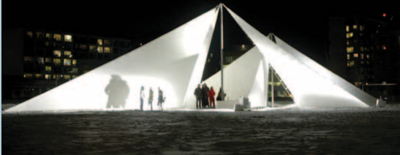
Fra projektet 'Windsails' (februar 2010) i Byparken i Ørestad af arkitekt Jes Vagnby