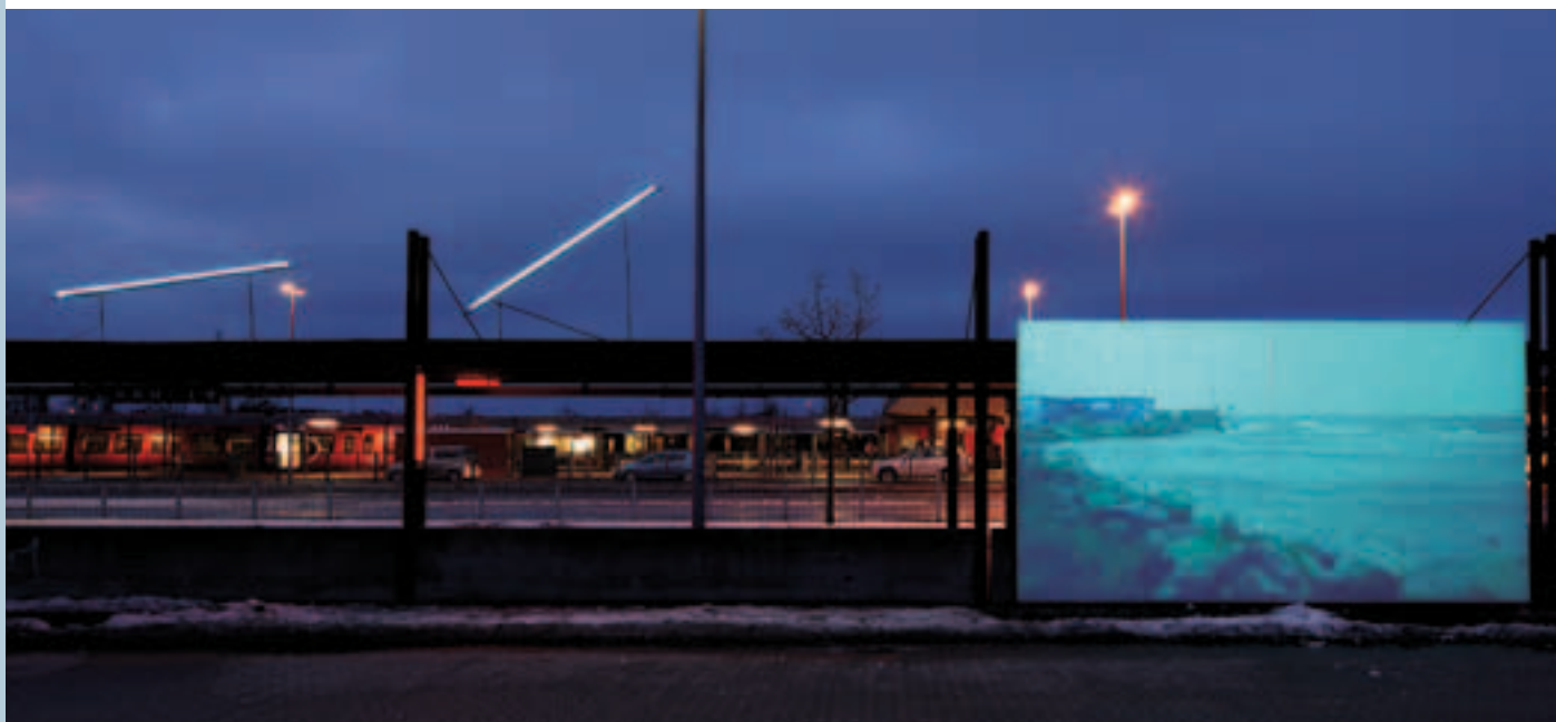
Foto: Fra installationen 'Mens vi venter' i Køge af Groupedunes (FR) ©Anders Sune Berg

Projektledelse: Københavns Internationale Teater ved Trevor Davies Støtte: Den Europæiske Fond for Regional Udvikling, Region Sjælland, Region Hovedstaden og de deltagende partnere Deltagende kommuner: Albertslund, Gribskov, Helsingør, Herlev, Hvidovre, Høje-Taastrup, Frederiksberg, Køge, Roskilde, København (Haraldsgadekvarteret områdeløft) Andre partnere: By & Havn, Juul | Frost Arkitekter, Seelite, Moto og Wonderful Copenhagen.