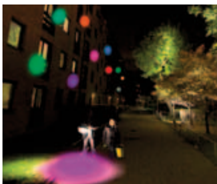
Illustration: Projektet 'SatellLight' af designere fra Mexico, Italien og Danmark