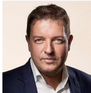
Radikale Venstre Boligordfører, MF Jens Rohde

Kommunerne har forskellige boligpolitikker. Hvad kan kommunerne gøre for at sikre det rette og varierede udbud af boliger, der kan matche demografien, familieformerne og danskernes økonomiske muligheder?