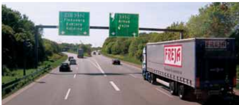
Den østjyske millionby vokser op omkring motorvejen.

I forlængelse af en sådan tankegang følger en lang række af spørgsmål: Har man trukket regiongrænserne det mest hensigtsmæssige sted, når der skal skabes politisk og planlægningsmæssig ramme for millionbyen? Hvad ønsker vi os af motorvejsbyen, og hvilke krav bør vi derfor stille til byvæksten? Hvad er perspektiverne, hvis det nuværende mønster for byvækst langs motorvejene fortsætter? Hvilke konsekvenser kan det få for de jyske randområder? Hvordan opleves byen og landskabet, når man bevæger sig udenfor bilen og væk fra vejen? Ser fremtidens bosætningsmønstre ud som de gør i dag, hvor den hurtige adgang til infrastruktur er afgørende?