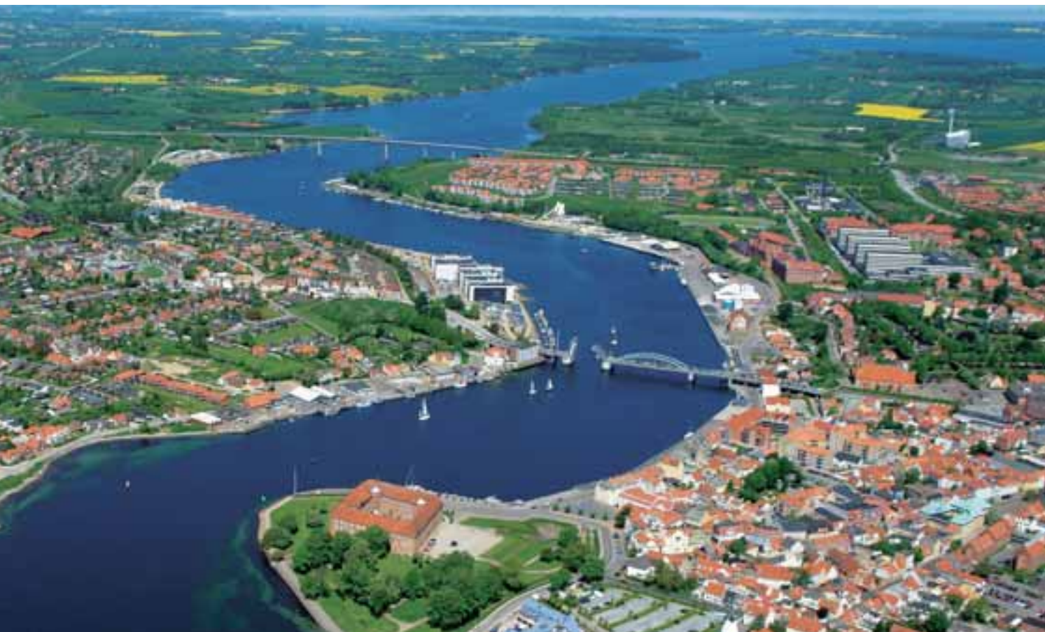
Sønderborg Havn set fra syd.

Det lykkedes gennem godt netværk at få kontakt med Gehry, og han var interesseret i at tegne et hotel – på betingelse af, at han også skulle lave en masterplan for området. Han lovede, at den ville passe med Kunstfondens input. Hans anden betingelse var, at der ikke 'gik politik i det'.