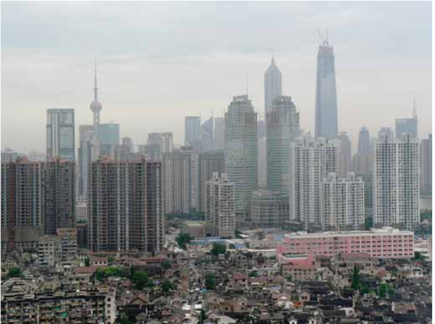
Shanghai skyline. Skalasammenstød.