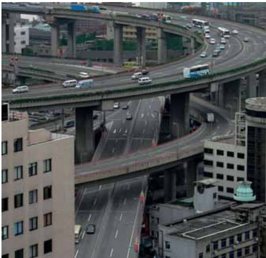
Bilen er symbolet på det nye Kina

Der er langt fra Danmark til Kina, men alligevel er der et skæbnefællesskab mellem kineserne og os. Det skaber både et stort marked for dansk miljøteknologi, men også en unik mulighed for at eksportere, udvikle og forstå den hjemlige planlægning.