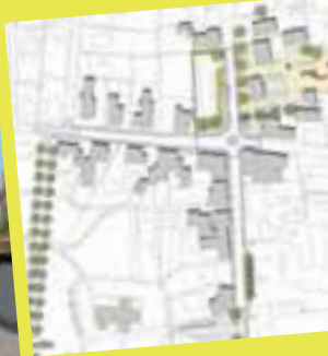
Udvikling af LANDSBYPLAN for Skodborg, Vejle Kommune. Omfattende plan med anvisninger af nye erhvervs- og boligudstyknings, forslag til forbedring af bymidtens udseende ved anbefalinger på belægning, belysning og byinventar, samt etablering af nye torvepladser. Desuden forslag til forbedring af trafikal infrastruktur.