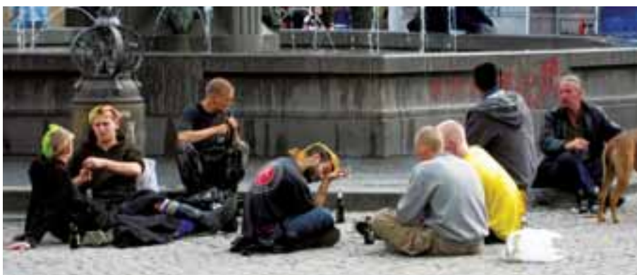
I den mangfoldige by er der plads til det anderledes, det skæve og det larmende.

I vores byplanlægning er der derfor et behov for, at vi reflekterer over de forskellige behov, der afspejler sig i de forskellige livsformer og livsfaser vi har, og derved ikke planlægger vores byer ud fra et stereotypet behovsbillede af en ”gennemsnitsborger”. Vi må gøre plads