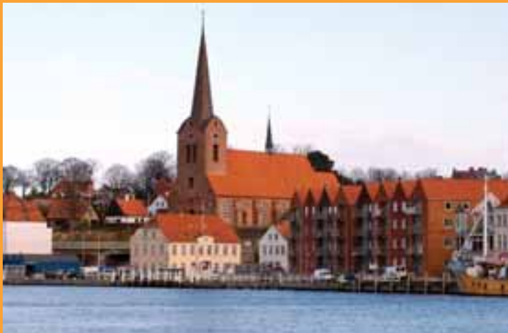
Solo, Sønderborg, Creo Arkitekter

Dette nummer er et tema- nummer, der knytter sig til Dansk Byplanlaboratoriums årlige byplanmøde i oktober, og som udsendes til alle mødets deltagere.