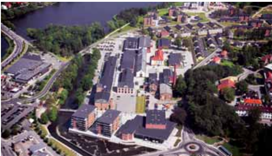
Gamle bygninger med nyt liv.

Silkeborg kommune med Henton ejendomme og Årstiderne Arkitekter