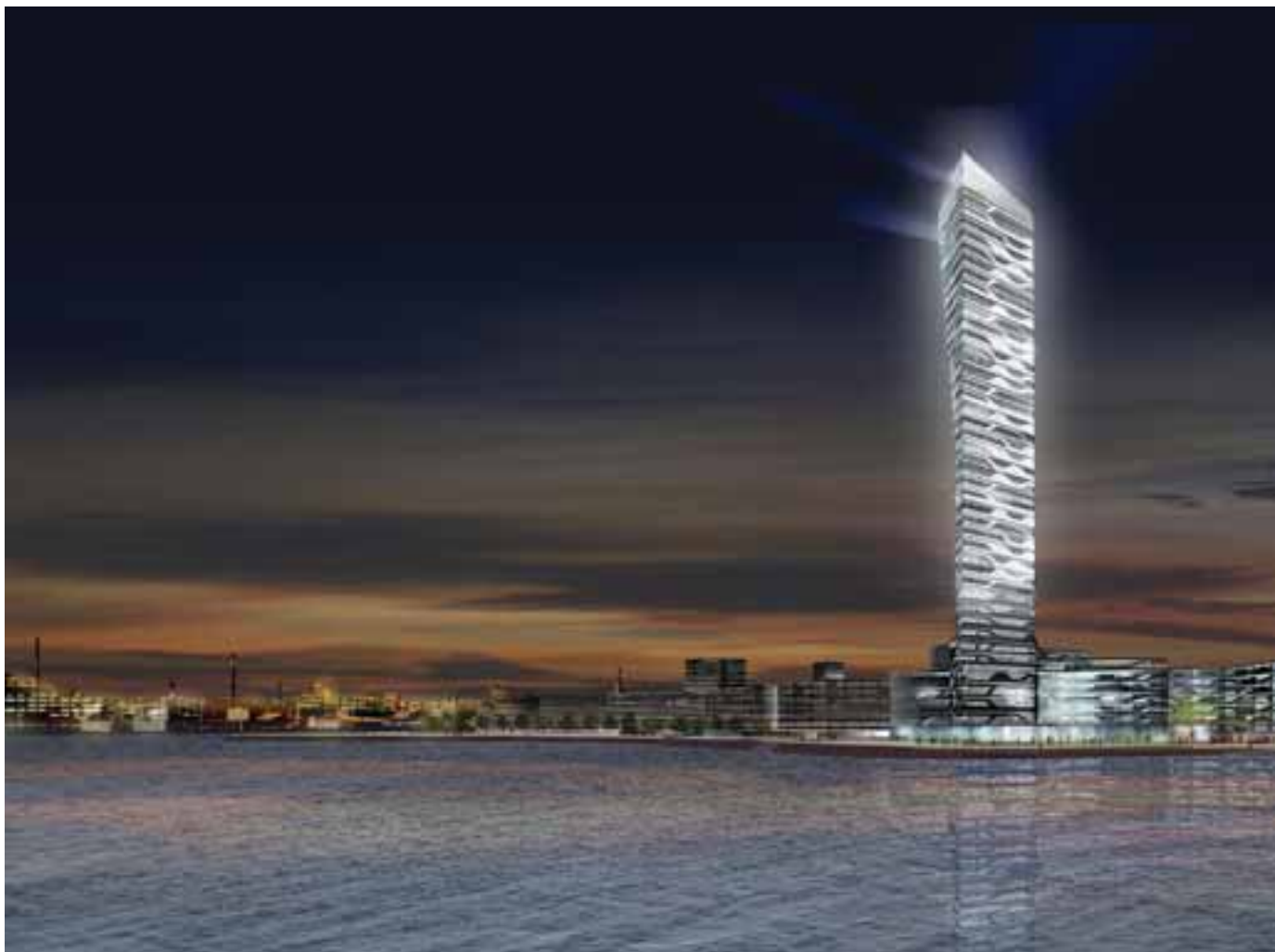
Århus' nye vartegn, Light*House, bliver Danmarks højeste hus. Illustration: 3XN, UNStudio og Gehl Architects

periode på 10 år har vores byplanlæggere udviklet sig til at være projektledere for de store projekter: At tiltrække virksomheder og at udvikle områderne. Og det er lykkedes! Vores byplansektion sidder også med køb og salg af fast ejendom”.