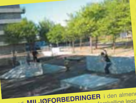
Renovering af udearealer i forbindelse med MILJØFORBEDRINGER i den almene boligafdeling Fjordparken, Kolding. Etablering af skater-/multibane, flere forskellige legeområder, opholdsarealer samt omfattende beplantning.