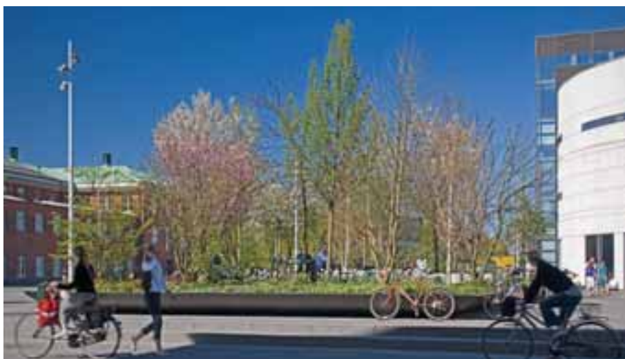
Plads til de bløde trafikanter: © SLA / Foto: Jens Lindhe