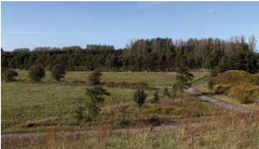
Nærheden til skoven udnyttes i lokalplanen.