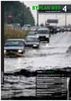
BYPLANNYT nr. 4 / 2007 (5. årgang)

Redaktion Ellen Højgaard Jensen (ansv.) NyWeisser Øhlenschläger