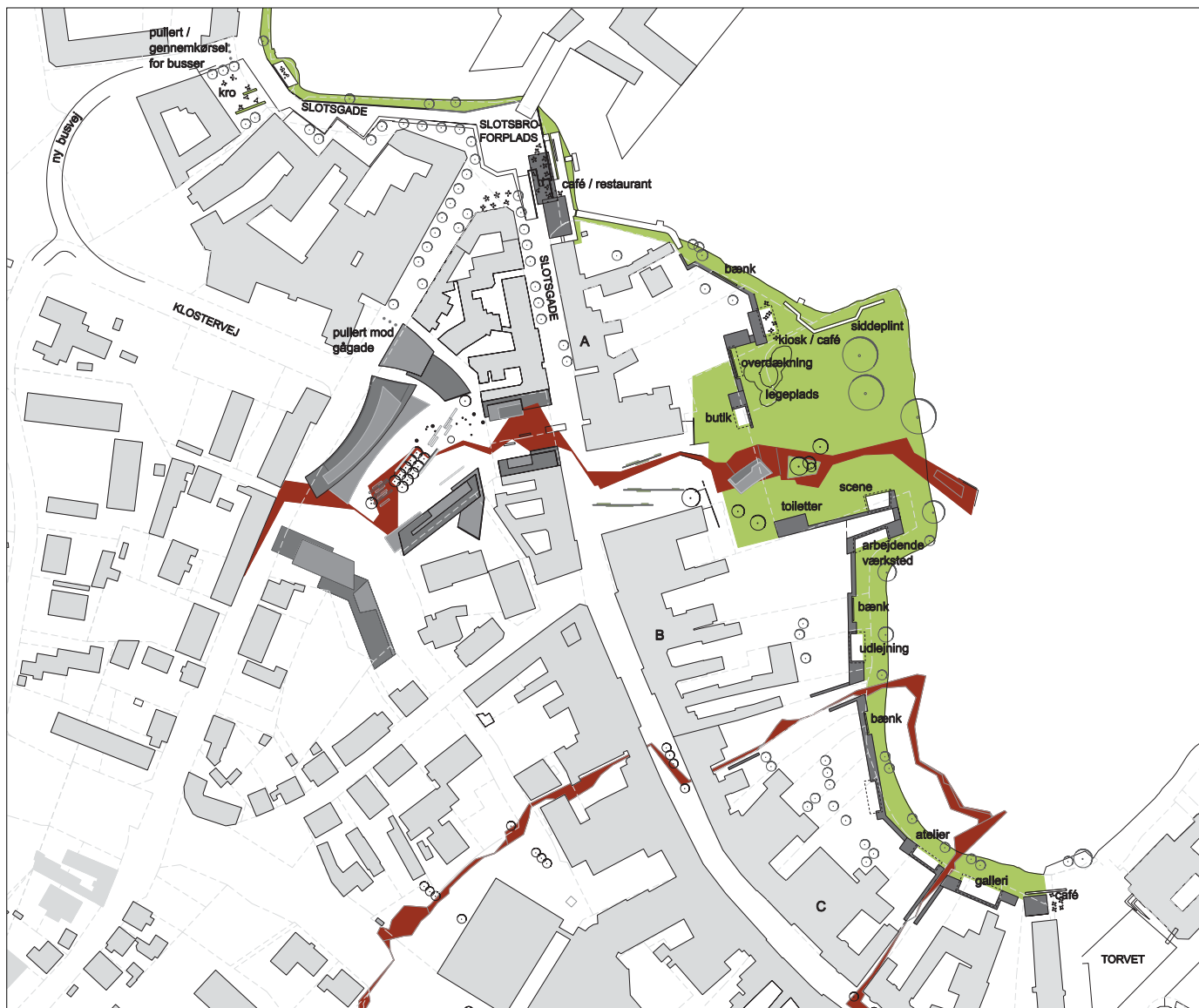
I helhedsplanen for Slotssøparken arbejdes med at forskønne og aktivere Hillerød bymidte.