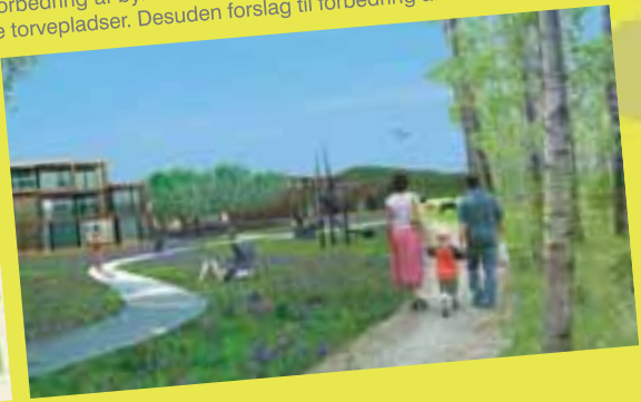
Delt 1. præmie i Hornshøj BYPLANKONKURRENCE . Forslag til et stort, nyt byområde med 2-3000 boliger, ny skole, offentlige og private funktioner, rekreative områder m.m. ved Hornshøj i Holstebro Kommune.