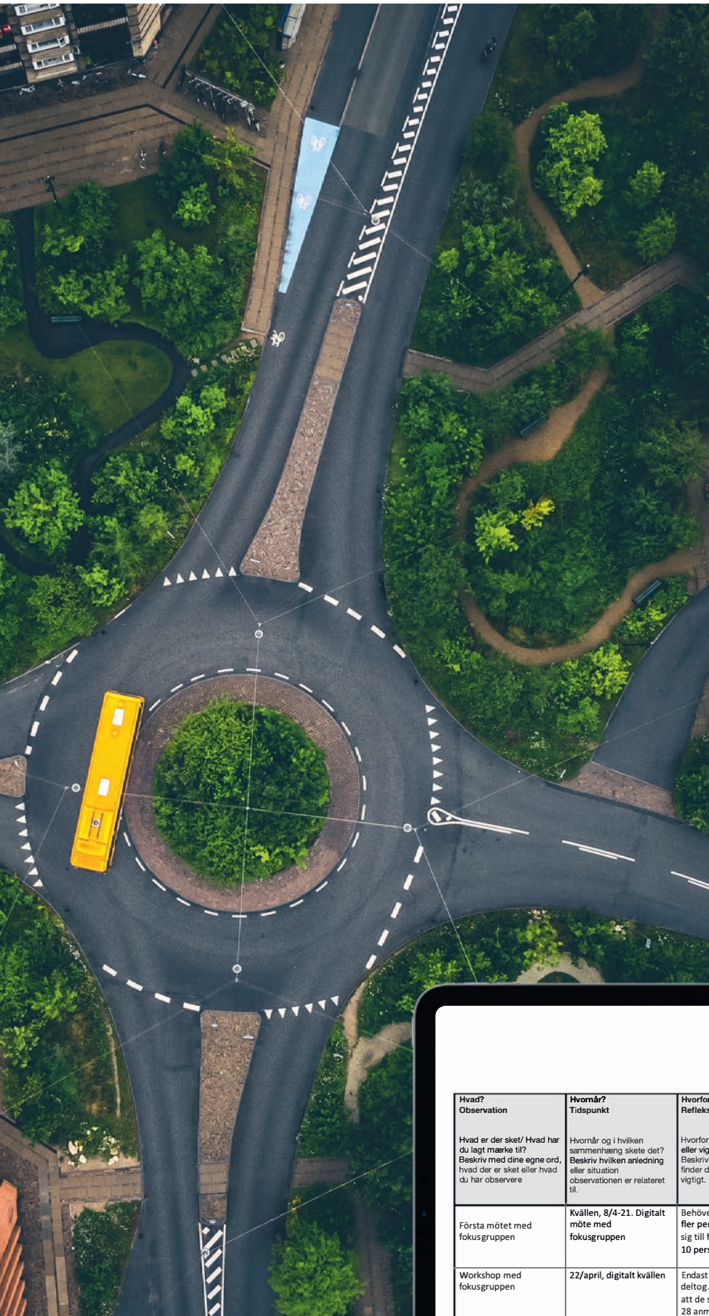
Feltdagbogsskabelon som kan dokumentere projektets detaljer og fastholde uforudsete input til projektføreløbet. Her udfyldt af en svensk planlægger.