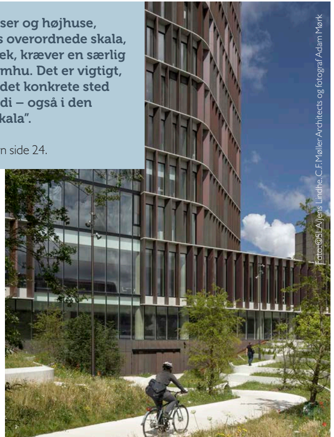
Foto: ©SLA/Jens Lindhe, C.F. Møller-Architects og fotograf Adam Mørk