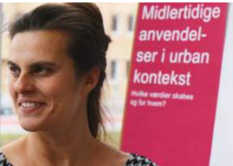
Samtale på Center for strategisk byforsknings stand.

markedsplads for gode idéer, er Transformationslaboratoriet også et sted, hvor Byplanlaboratoriet kan tage temperaturen på de vigtige diskussioner. En af de stande, som trak rigtig mange deltagere handlede om Business Improvement Districts (BID). Et BID er en model for, hvordan private og offentlige aktører kan have et fælles ansvar for drift og vedligehold af dele af det offentlige rum. Det er ikke muligt at love for BIDs i Danmark, men der laves forsøg med frivillige ordninger i Aalborg og Gladsaxe. På standen blev det blandt andet diskuteret, hvordan man kan implementere et forpligtende samarbejde i praksis, og hvordan det kan matche en nordisk velfærdsmodel. Det er tydeligvis et emne, som optager planlæggere og beslutningstagere i kommunerne. Byplanlaboratoriet vil følge emnet tæt i 2017, hvor vores indsatsområde er 'Erhverv, planlægning og mobilitet'.